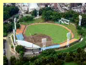
藤崎台県営野球場