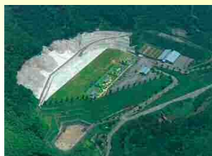
熊本県総合射撃場