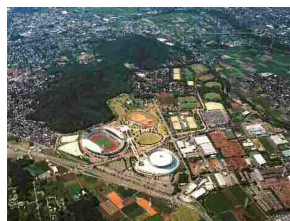
熊本県民総合運動公園