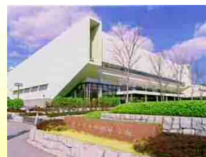
熊本県立総合体育館