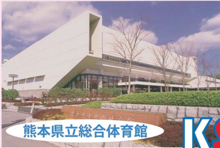
熊本県立総合体育館